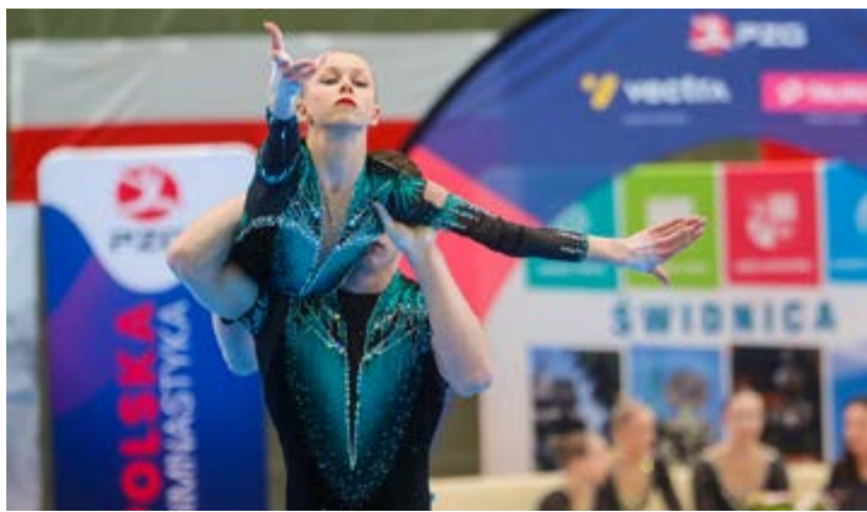
Akrobaci dali popis swoich umiejętności.