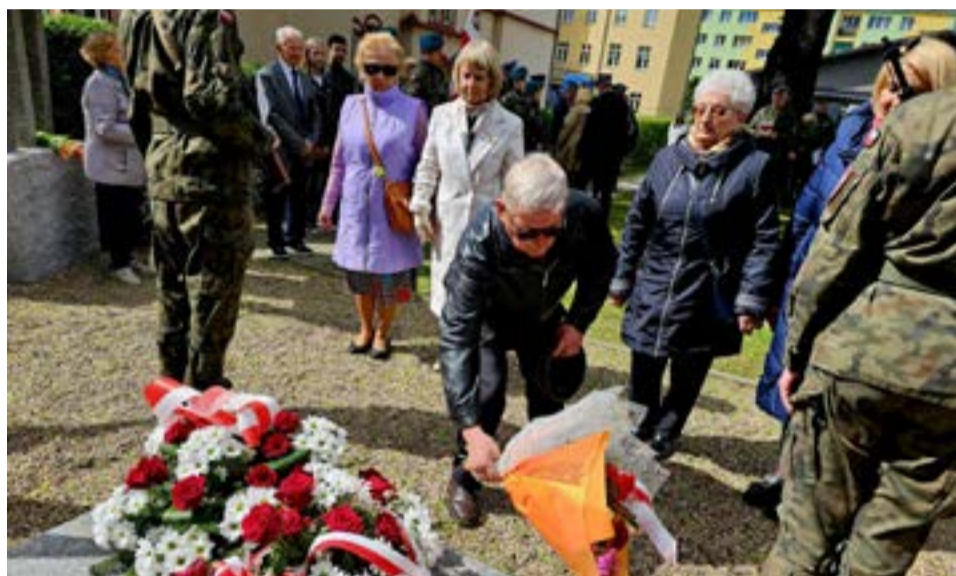
Delegacje złożyły pod pomnikiem symboliczne wieńce.