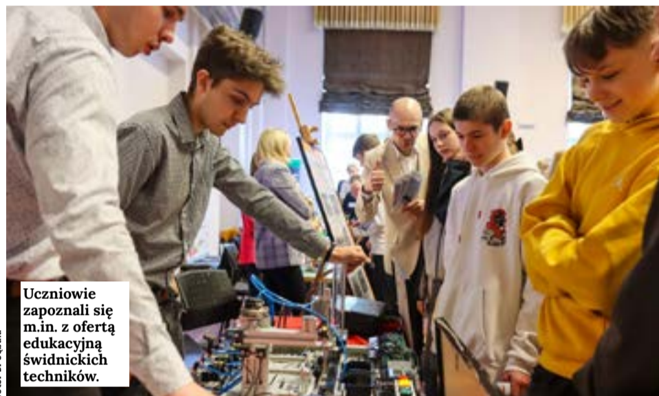
Uczniowie zapoznali się m.in. z ofertą edukacyjną świdnickich techników.