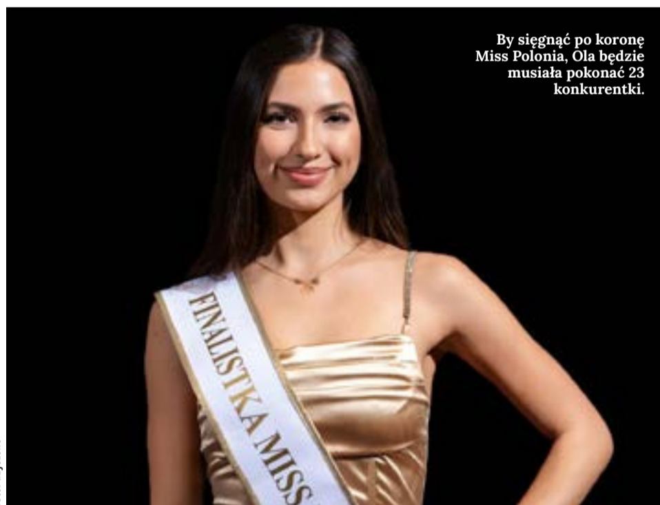
By sięgnąć po koronę Miss Polonia, Ola będzie musiała pokonać 23 konkurentki.