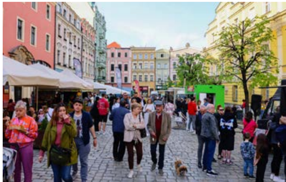
W sercu miasta pojawiły się prawdziwe tłumy.