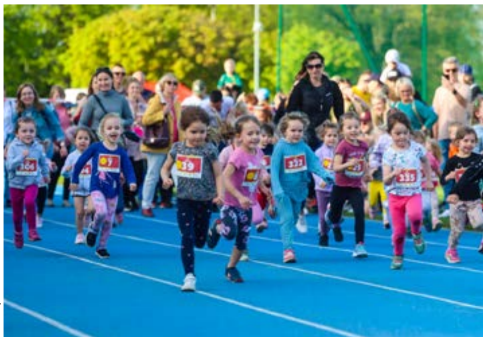
Dzięki Świdnickim Czwartkom Lekkoatletycznym dzieci spędzają aktywnie swój wolny czas.